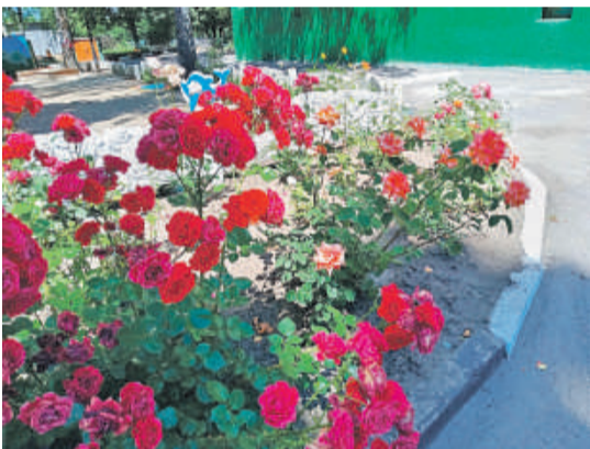
Детсад № 48 «Вишенка» г. Белгорода