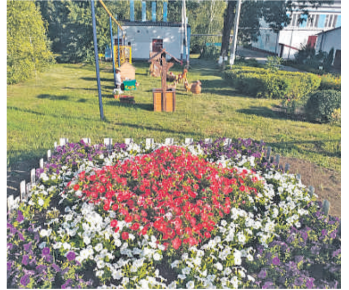
Старобезгинская школа Новооскольского городского округа

Павел КОЛЯДИН, Александра ПИВОВАРОВА, Полина ОВСЯННИКОВА, Ирина ГАНАГИНА, архивы школ и детских садов » ФОТО