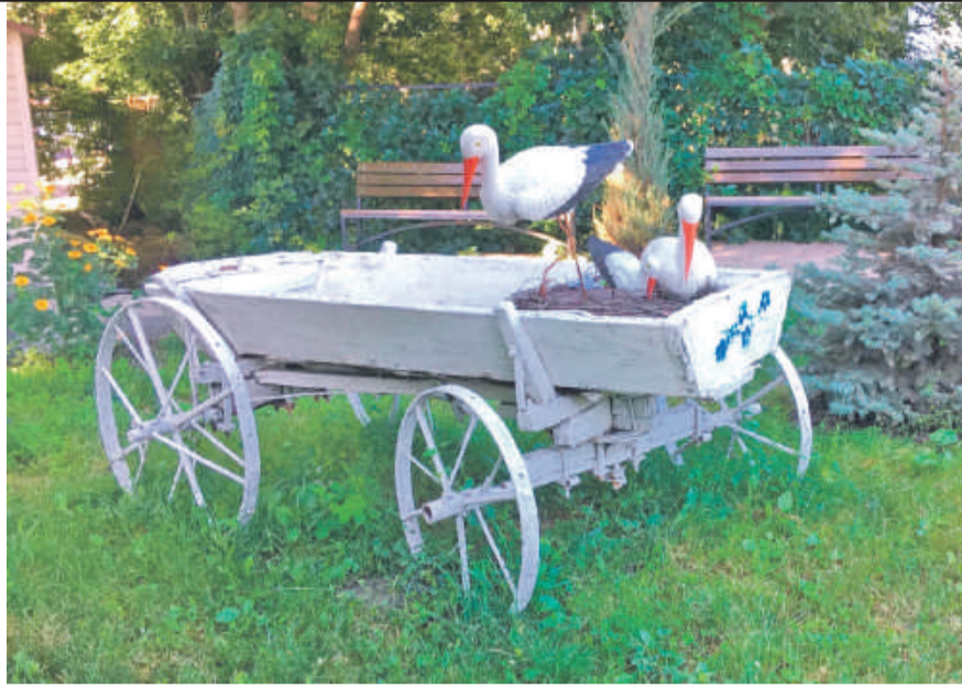
Центр образования № 1 г. Белгорода