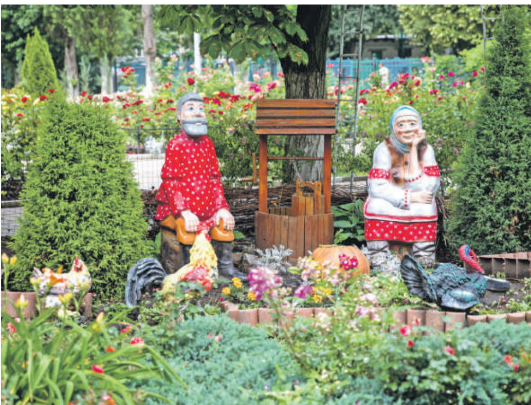
Школа № 41 г. Белгорода