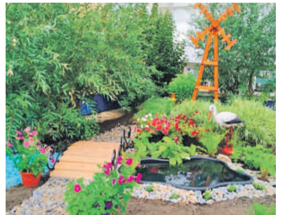
Рождественская школа Валуйского городского округа