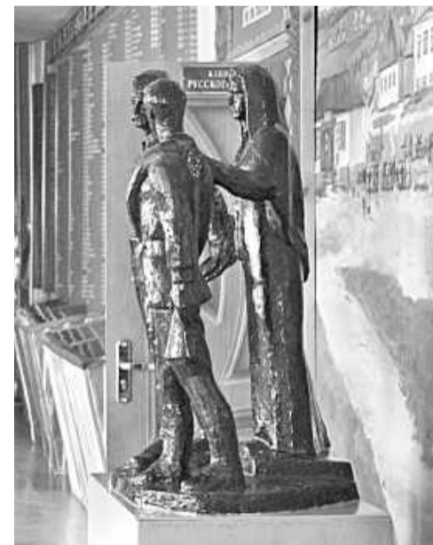
Школьный музей Великой Отечественной войны

Уверена в том, что в школе всегда ведущей и главной должна быть функция воспитания, ответственности за формирование человеческой личности. В детях необходимо формировать нравственные принципы, делая это незаметно и каждодневно. В нашей школе детей и педагогов связывают