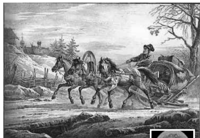
Настоящая кибитка — это крытая повозка, как на этой литографии Александра Орловского «Путешественник в кибитке, или Сани, запряжённые тройкой» (1819, Киевская картинная галерея)

Другие ученики назвали кибитку «птичкой», летящей с Кубы и крыльями поднимающей снег»; «поездом, который очень быстро едет, и поэтому снег летит вверх и вниз» и даже «кибернетической, шустрой тёткой». Ямщик, по их мнению, оказался «дядей, профессия которого — таскать ящики»; человеком, роющим ямы, вероятно, карликом, «потому что сидит на чём-то маленьком и прячется в ямку».