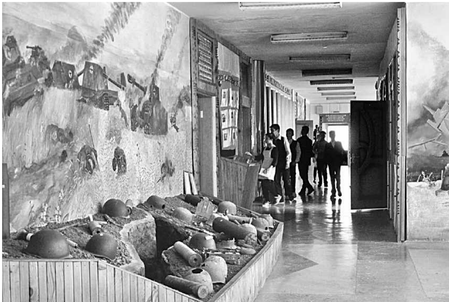
Школьный музей Великой Отечественной войны