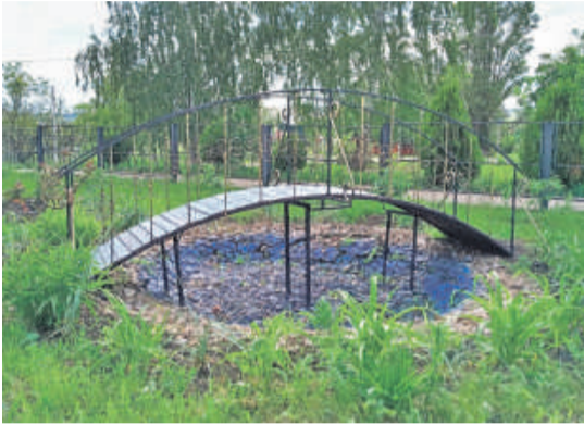
Уразовская школа № 2 Валуйского городского округа