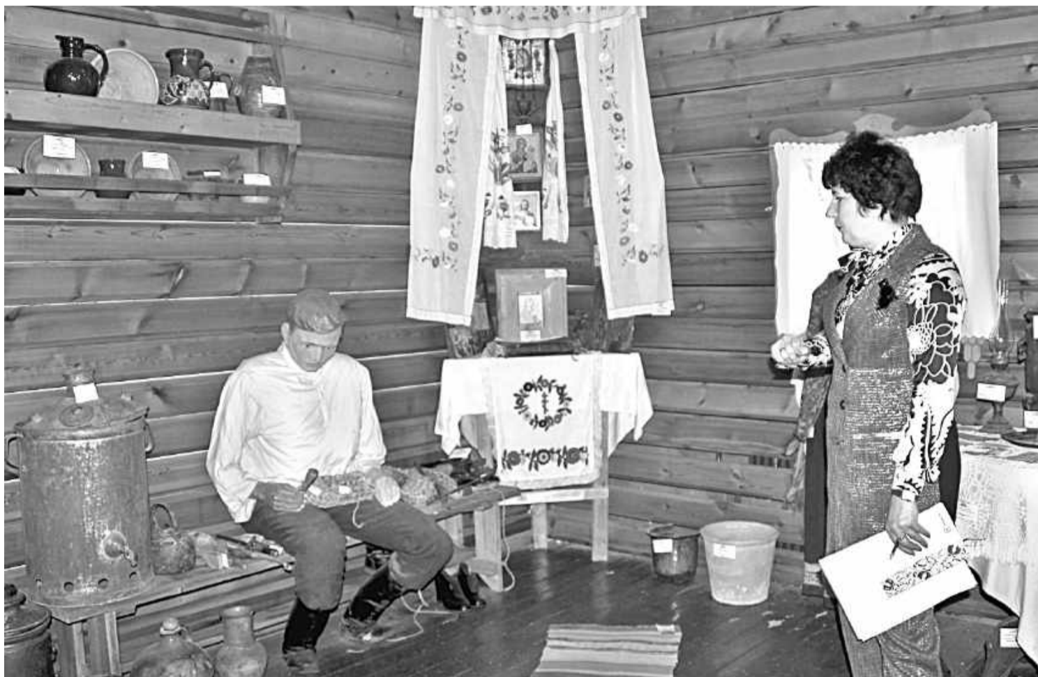
В школьном музее этнографии

НО ДАЖЕ САМОЕ КРАСИВОЕ, ПУСТЬ И ДОБРОЖЕЛАТЕЛЬНОЕ ОФОРМЛЕНИЕ МОЖЕТ СТАТЬ БЕСПОЛЕЗНЫМ, БЕЗДЕЙСТВЕННЫМ,