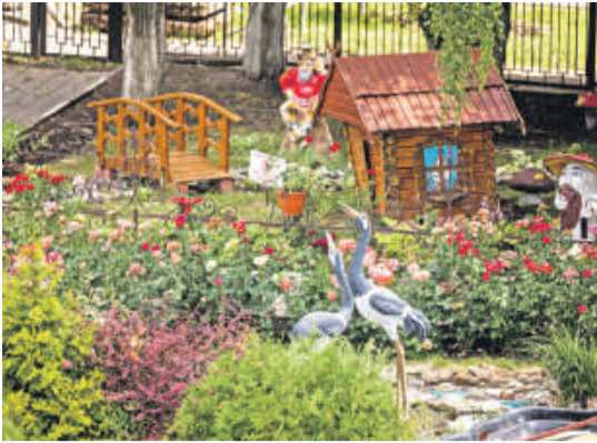
Школа № 41 г. Белгорода