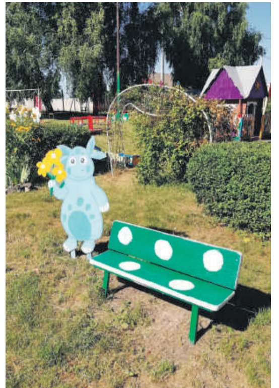
Детсад № 4 с. Алексеевка Корочанского района