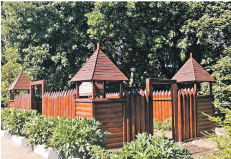
Школа № 4 г. Валуйки

Школа начинается со школьного двора. От того, как он обустроен, зависит многое. Настроение ребят и учителей. Их желание идти в школу. Адаптация первоклассников к учебной жизни. Недаром на Белгородчине уже много лет проводят конкурсы на лучшее обустройство школьных территорий. Если к делу подойти с душой, то школьный двор можно превратить и в ботанический, и в сказочный сад, и в обучающее пространство. В группе «Доброжелательная школа Белогорья» в соцсети «ВКонтакте» мы попросили учителей и учеников поделиться с редакцией фотографиями дворов их школ. И детских садов. Давайте вместе полюбуемся на нашу школьную красоту! Ну и в нашем редакционном портфеле кое-что нашлось.